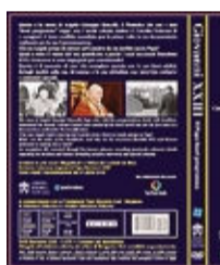
Dvd: fronte e retro

«Giovanni XXIII. Il papa fuori programma» narra di una vita esemplare attraverso le frasi celebri del Papa, dettagli inediti sulla sua devozione e le sue abitudini, con interviste esclusive e contenuti speciali. L'opera contiene le arie sacre «Magnificat» e «Omni Die» - cantate da Mina - e i discorsi originali di Papa Giovanni XXIII.